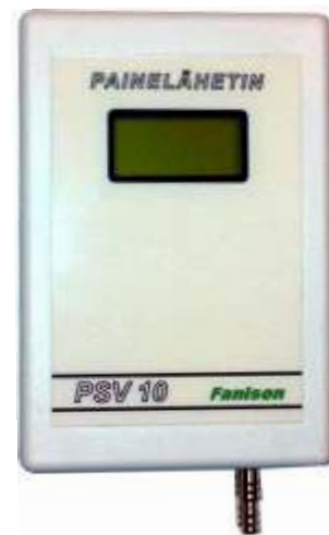
Mitat: 110x75x37 (LxBxH)

Paine-erolähetin ohjelmoitavalla mittausalueella 50 .. 1000 Pa ja lineaarisella ulostulolla paine-eron tai ilmamäärän suhteen. Mittausviestin k-kerroin ja ulostuloviestin alue voidaan ohjelmoida sopivaksi. Lähettimessä on myös aseteltava hälytysrele ja automaattinen lähettimen nollaustoiminto. Näytöstä on luettavissa mitattu paine Pa tai ilmamäärä l/s.