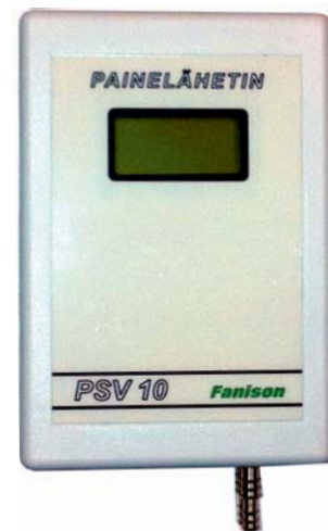
Mitat: 110x75x37 (LxBxH)

Paine-erolähetin ohjelmoitavalla mittausalueella 50 .. 500 Pa ja lineaarisella ulostulolla paine-eron tai ilmamäärän suhteen. Mittausviestin k-kerroin ja ulostuloviestin alue voidaan ohjelmoida sopivaksi. Lähettimessä on myös asetettava hälytysrele ja automaattinen lähettimen nollaustoiminto. Näytöstä on luettavissa mitattu paine Pa tai ilmamäärä l/s.