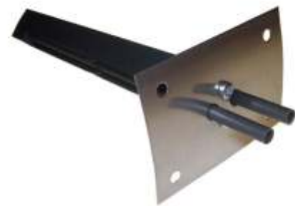
(Kanavassa reikä Ø32)

Mittauslaite asennetaan kanavaan tehtävään aukkoon mahdollisimman häiriöttämään ilmavirtaukseen.