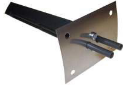
(Kanavassa reikä \varnothing 32 )