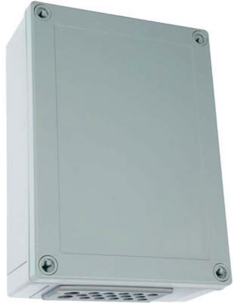
Mitat: 180 x 130 x 60 ( L x B x H )

Sar 410 voidaan liittää Modbus RTU väylään lisävarusteena saatavan MB20 liitäntäyksikön avulla.